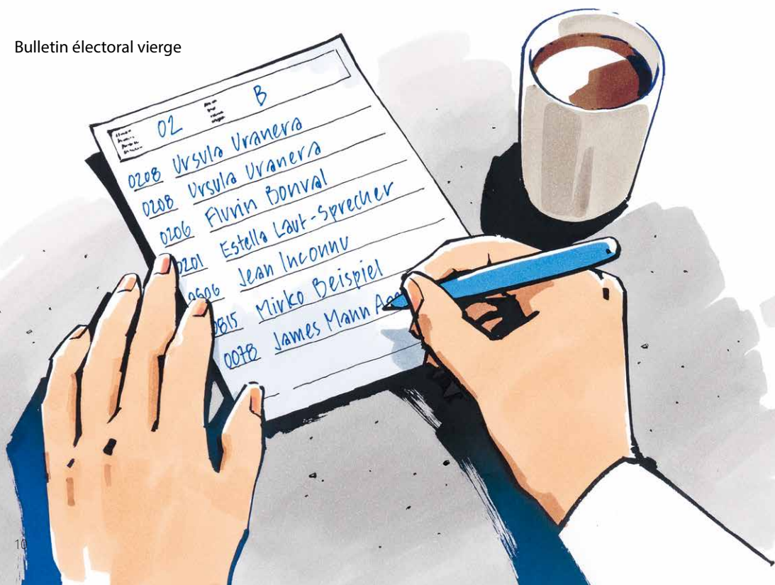
Bulletin électoral vierge

Si aucun nom ou numéro de parti n'est inscrit, les lignes laissées en blanc ne sont pas comptabilisées en faveur d'un parti.