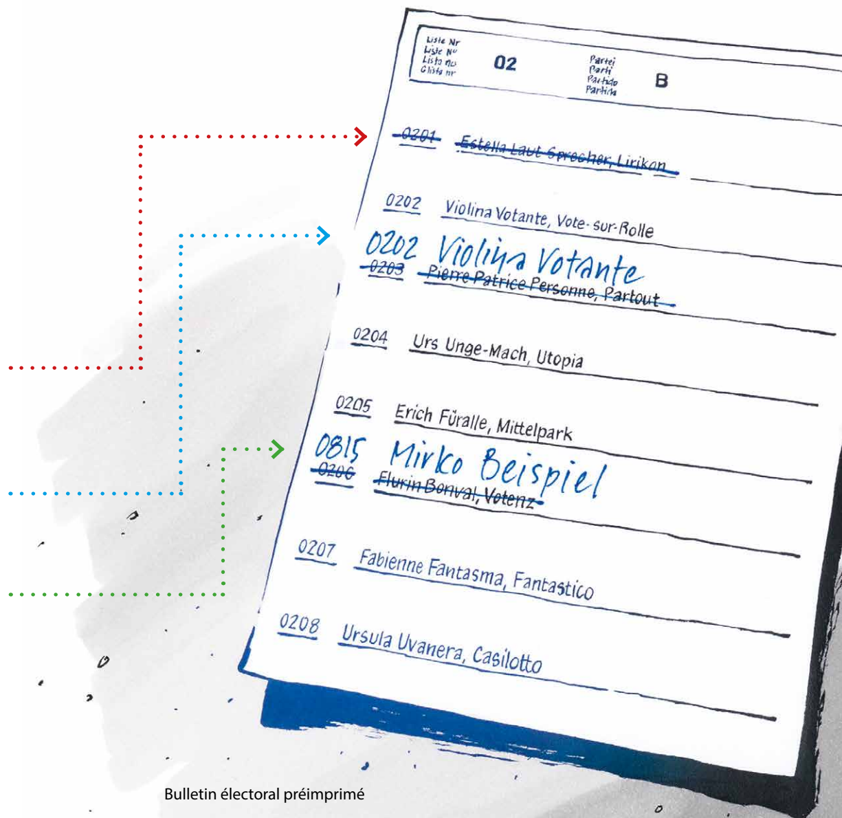
Bulletin électoral préimprimé

Le nombre de noms figurant sur le bulletin électoral ne peut être supérieur à celui des sièges attribués au canton concerné.